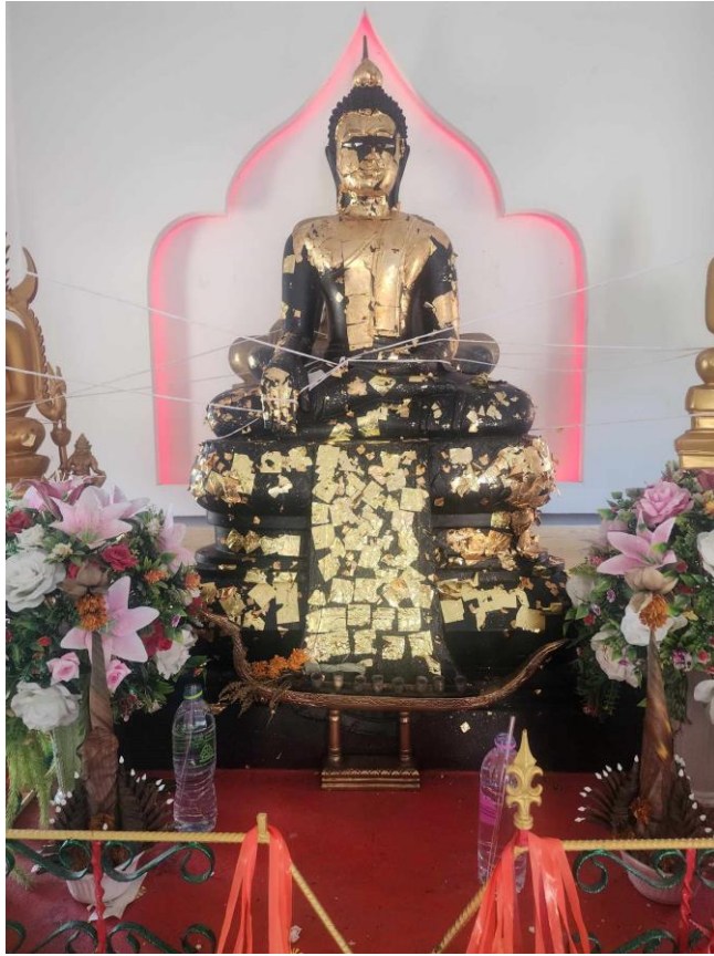
รูปจำลอง“หลวงพ่อเสียงทายวัดท่าฉนวน”