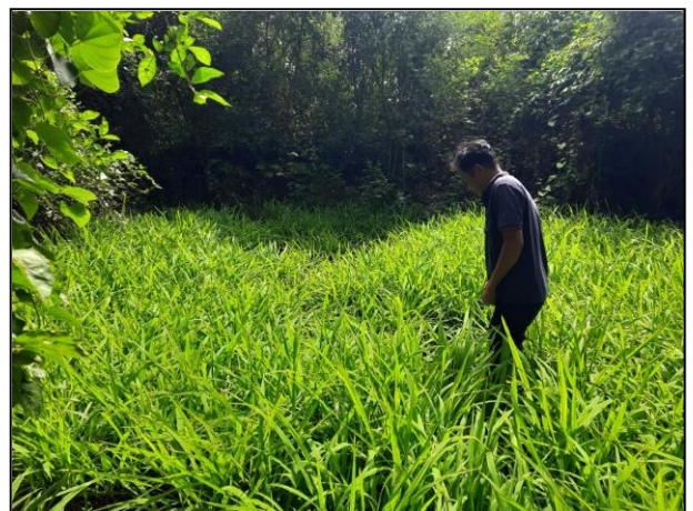
สระน้ำสำหรับพรานใช้สอยในอดีต