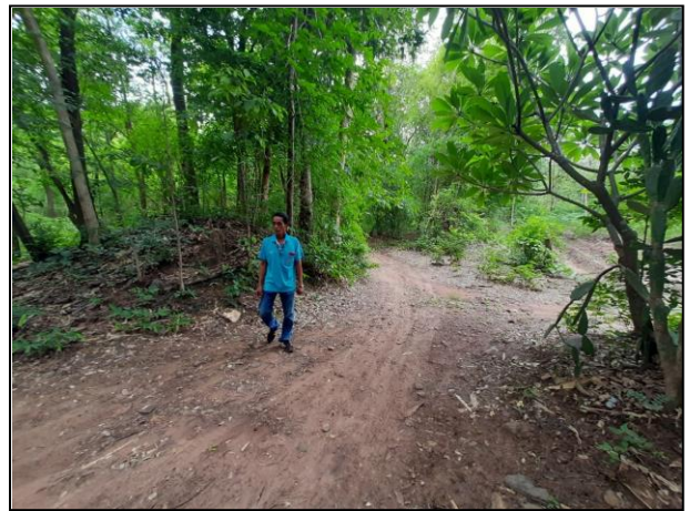
คันคู(ไวกิ้งเพนียด)