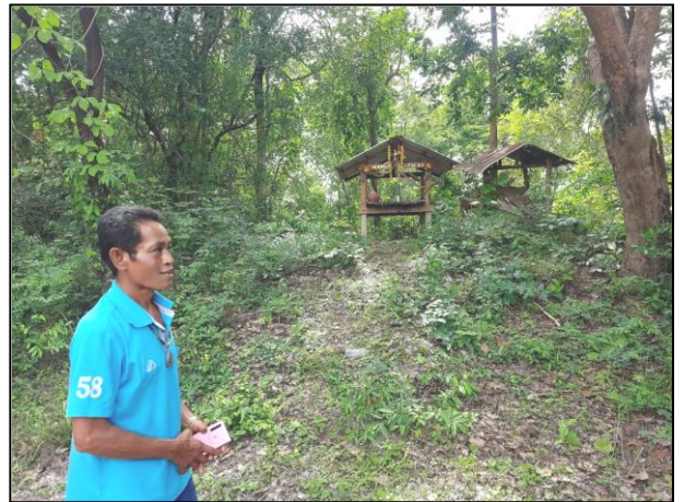
สระตลุงในปัจจุบัน